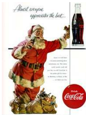
Rysunek Haddona Sundbloma z 1955r.

Zmienił on nieco wizerunek wykreowany pół wieku wcześniej przez Thomasa Nasta. Stworzył świętego Mikołaja wysokiego i potężnego, z białymi włosami, wąsami i długą białą brodą. Strój utrzymano w barwach czerwonej i białej.